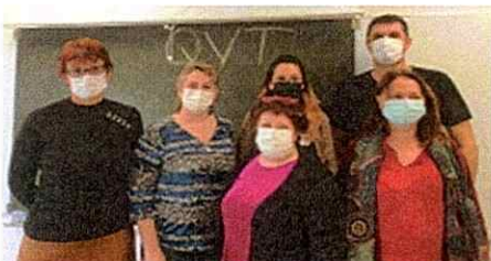
Une partie du groupe QVT